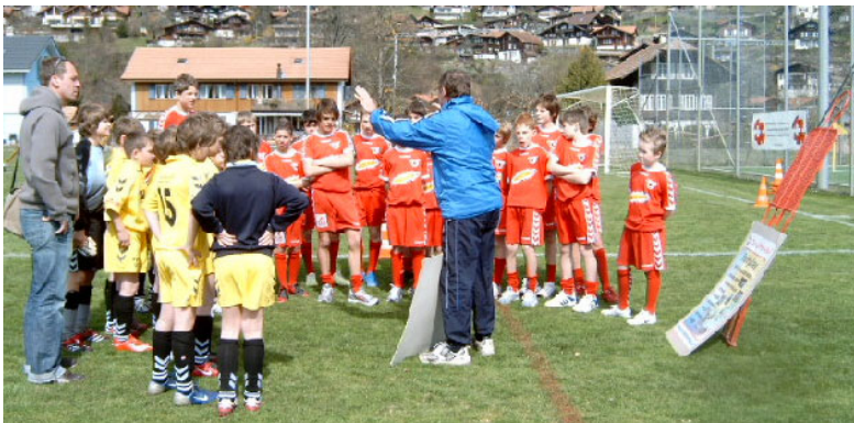
Nach kurzer Einweisung geht es auf den Parcours

Interlaken - 16 Spieler der U13-Junioren des FC Thun haben am Sonntag, 30.03.08, beim FVBO-Stützpunktturnier der D-Junioren in Interlaken das Trainingsprogramm «Die 11» vorgeführt. Der Präventionseinsatz erfolgte im Auftrag des Schweizerischen Fussballverbandes unter der Leitung von Wolfgang Unger.