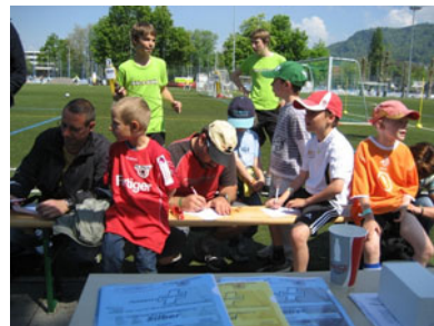
Bei der Anmeldung

Entsprechende Aufmerksamkeit war also vom FC Thun-Nachwuchs gefordert.