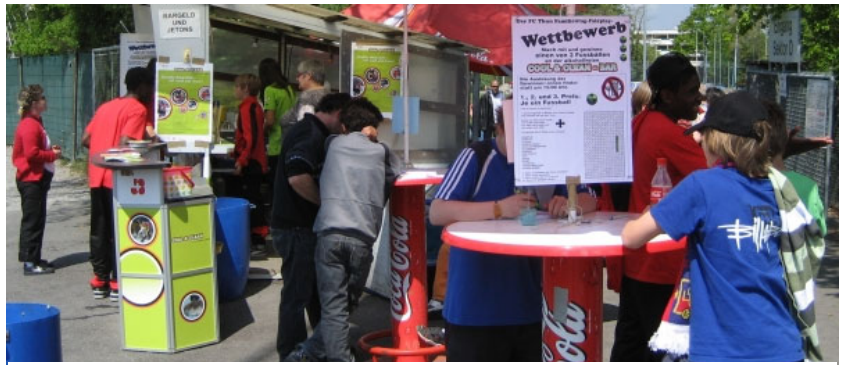
Rätselraten beim Fairplay-Wettbewerb an der Cool & Clean Bar