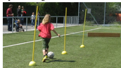
Auch Mädchen können dribbeln

Nicht nur an den Übungsstationen, sondern auch bei der Anmeldung der Kandidaten/-innen, bei der Ausgabe der Ergebnisblätter und bei der abschliessenden Ausstellung der Diplome. Allesamt Aufgaben, die in den Händen der jungen Sportler lagen.