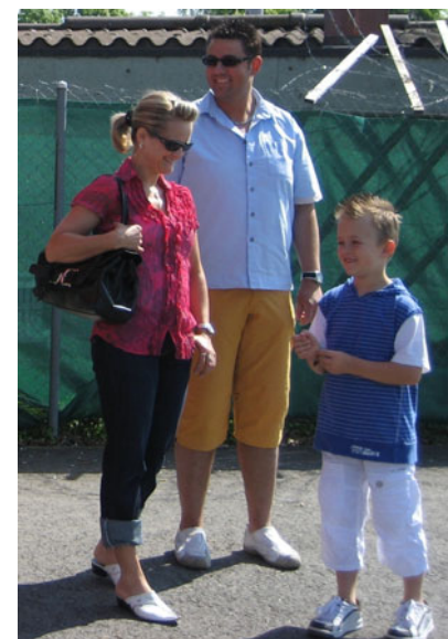
Gut aufgelegte Besucher am Familientag

Das ausgesprochen positive Echo, das die Aktion bei den Besuchern und Besucherinnen gefunden hat, lässt darauf hoffen, dass es auch im kommenden Jahr beim Familientag des FC Thun die Möglichkeit geben wird, Fussball-Diplome zu erwerben oder die bereits erworbenen zu verbessern.