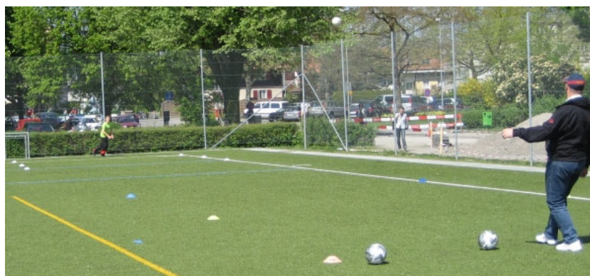
Ein Flankenball auf dem Weg ins Zielquadrat

Die elfte Übung von «Die 11» besteht üblicherweise aus einem Fairplay-Appell und wur-