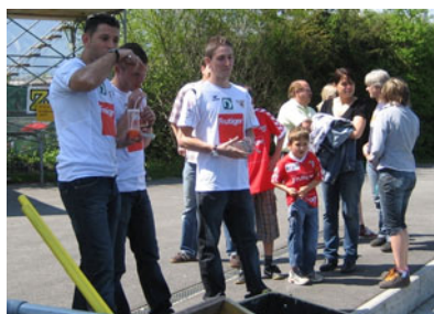
Kompetente Besucher

Besucher und Besucherinnen jeden Alters waren eingeladen, unter dem Motto "Cool & Clean" den Fussballtechnik-Parcours mit fünf Stationen plus einer Station «Die 11» zu absolvieren und sich bei entsprechender Leistung ein Diplom in Gold, Silber oder Bronze abzuholen.