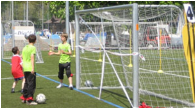
Station 4 – Kopfball

Auf halbem Wege des Technik-Parcours erwartete die Absolventen die Station mit dem PLUS: Sie erhielten die Möglichkeit, die zehn Übungen des Trainingsprogramms «Die 11» beim Zusehen und Mitmachen unter Anleitung der Fairplay-Botschafter der U13/U14 FC Thun BeO kennenzulernen.