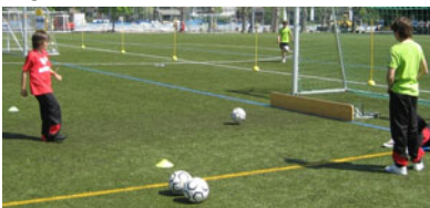
Kurzpässe für das Gold-Diplom

Obwohl mancher Besucher und manche Besucherin dabei erfahren musste, dass die Durchführung der Kräftigungsübungen einiges an Übung erfordert, hatten alle ihren Spass dabei. Besonders wichtig an dieser speziellen Station war die Beobachtung und nötigenfalls die Korrektur der von den Teilnehmenden ausgeführten Übungen. Diese Aufgabe wurde den Spielern der U13/U14 gewissenhaft erledigt.