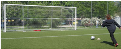
Ob der Penalty reingehet?

Auf halbem Wege des Technik-Parcours erwartete die Absolventen die Station mit dem PLUS: Sie erhielten die Möglichkeit, die zehn Übungen des Trainingsprogramms «Die 11» beim Zusehen und Mitmachen unter Anleitung der Fairplay-Botschafter der U13/U14 FC Thun BeO kennenzulernen.