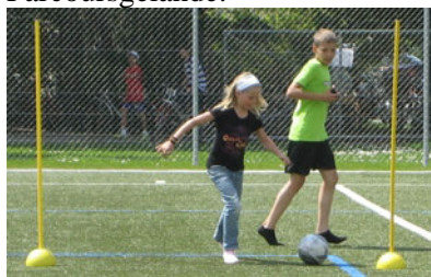
Betreuung beim Dribbeln

Die Spieler und Trainer der Nachwuchsmannschaften U13/ U14 des FC Thun BeO betreuten die sechs Stationen auf dem Parcoursgelände.